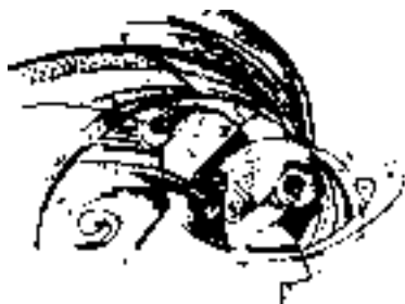
Za Unitářskou mozaiku Sofie a Pepa

Co ještě dodat? Hodila by se nějaká výzva. Vyzývat k něčemu okolní veřejnost si netroufáme, ale sestry a bratry v Unitarii bychom možná k něčemu vyzvat mohli. Pište nám o tom, co ve svých obcích děláte. A posílejte svoje programy akcí, až se co nejvíce lidí dozví, čeho zajímavého se ve vašich obcích mohou zúčastnit. Jsme tu pro vás.